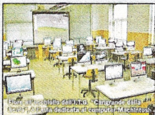
Foto: il Presidio dell'area "Cangrande della Scala", aula dedicata al computer didattico.

Organismi della scuola Consiglio d'Istituto: organo politico di indirizzo e controllo; Collegio Docenti: organo professionale per la progettazione didattica - educativa; Dirigente: organo di gestione. Assegnazione degli incarichi secondo criteri qualitativi: competenze, conoscenze, attitudini; capacità di operare in una logica di perseguimento di risultati (efficacia, efficienza, economicità); disponibilità ad operare secondo logiche non mansionaristiche; etica della responsabilità; patto fiduciario, non appiattimento, differenziazione nella negoziazione delle risorse. Istituto accreditato presso la regione Veneto per la Formazione Superiore e l'Orientamento. Certificazione di Qualità rilasciata da SGS - Sincert nel giugno 2008 per la Progettazione ed erogazione di servizi di Istruzione Superiore e Formazione.