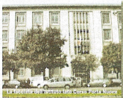
La facciata dell'Istituto I.T.G. Corso Porta Nuova

Organizzazione a cura di ITG "Cangrande della Scala" - E-Valuations - Collegio Geometri e Geometri laureati della Provincia di Verona