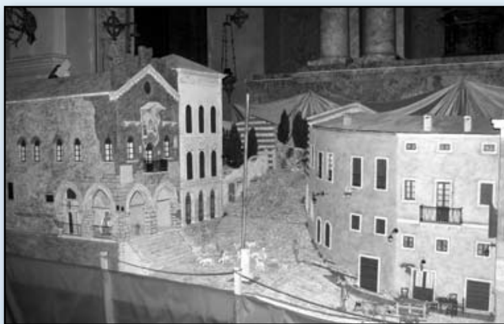
Il presepe nella chiesa parrocchiale

Puntuali si è partiti poi con le esibizioni. Quest'anno un inizio inedito: una sigla che i giovani talenti della Ginnastica Artistica Est Veronese e della Soave Dance Studio hanno proposto rispondendo con puntualità all'appello dell'Assessore allo Sport e Associazioni di iniziare con “un numero” particolare.