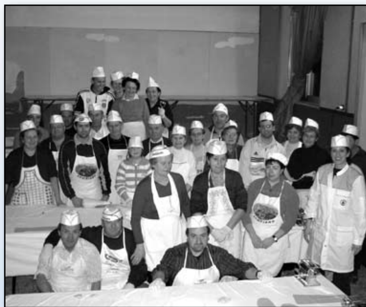
"I pasticceri" di Costeggiola