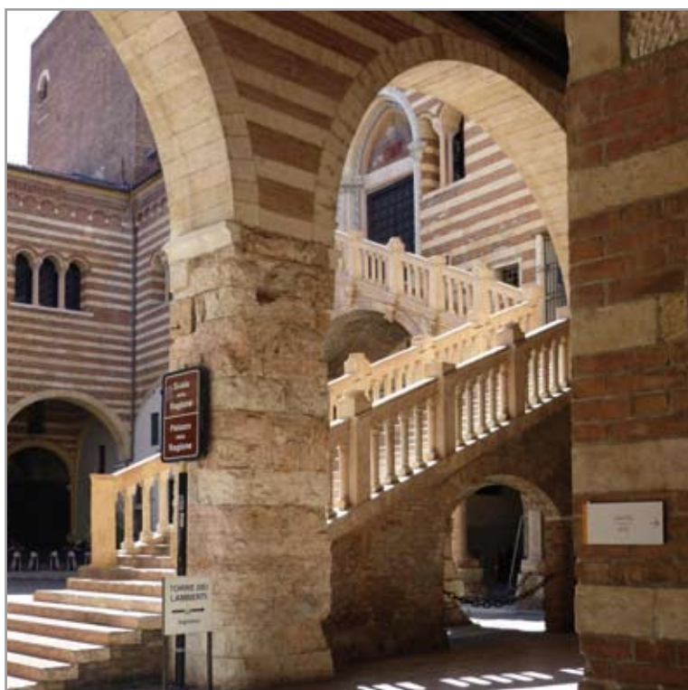
PALAZZO DELLA RAGIONE sec. XII

Questo mio omaggio alla nostra splendida città è rivolto alle grandi architetture del culto cristiano dove ciascuno di noi ha riposto e ripone sgomento e meraviglia, dolore e gioia, attraverso gli occhi ed il cuore, nelle preghiere della speranza.