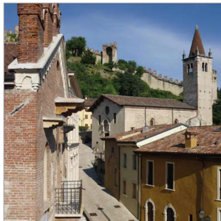
CHIESA DEI DOMENICANI sec. XV